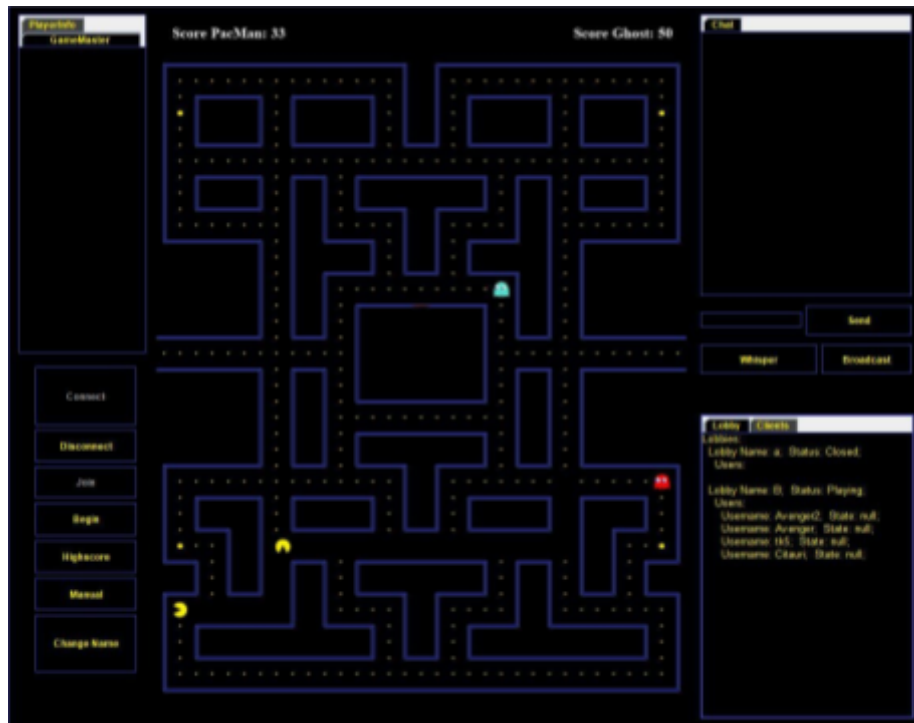
Screenshot des laufenden Spiels